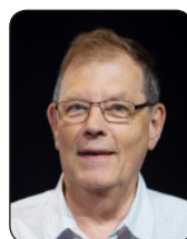
SECRÉTAIRE GÉNÉRAL Bruno LE MAIRE