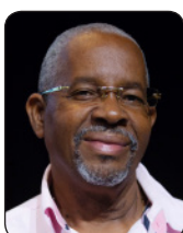
OUTREMER HÉMISPHERE NORD Henri CAGE