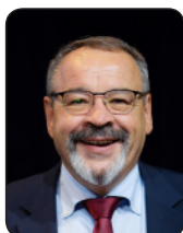
PRÉSIDENT Luc GATEAU