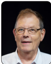
AUVERGNE RHÔNE-ALPES Bruno LE MAIRE