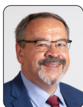
PRÉSIDENT Luc GATEAU