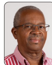
OUTREMER HÉMISPÈRE NORD Henri CAGE