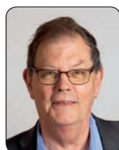
Bruno LE MAIRE