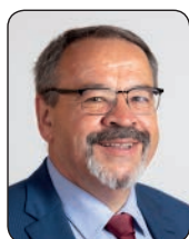
PRÉSIDENT Luc GATEAU