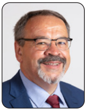
PRÉSIDENT Luc GATEAU